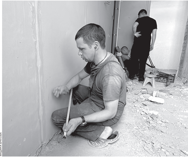
В здании поликлиники ведутся отделочные работы

Так, в настоящее время специалисты заняты заменой инженерных коммуникаций, а также монтажом современных систем кондиционирования и вентиляции. Завершаются внутренние и фасадные штукатурные работы. На верхних этажах выравнивают полы, проведена штукатурка, частично заменены стеклопакеты. В настоящее время ремонтные бригады трудятся на первом и втором этажах, затем будут установлены новые современные просторные лифты. Не забыли и про маломобильных граждан, для них будут установлены пандусы, которых здесь ранее никогда не было. — При планировании работ все технические решения принимались с сотрудниками медучре-