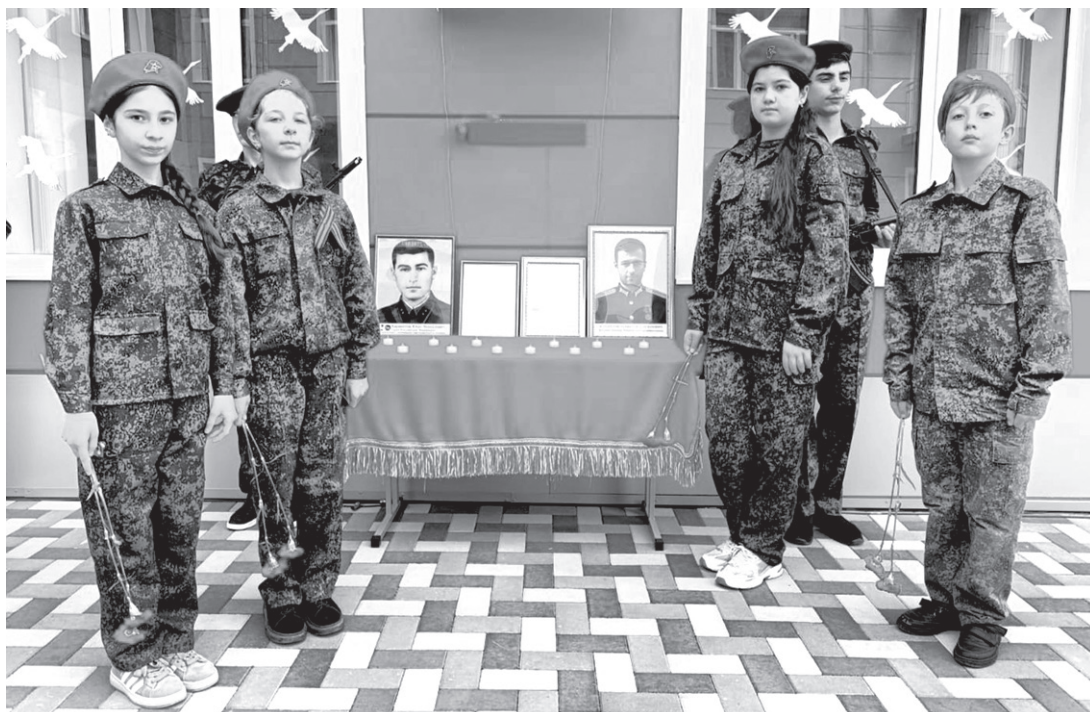
В почете карауле у мемориальной доски героя

Спустя 80 лет подвиг нашего земляка, Героя России Ю. Каракетова повторили его потомки.