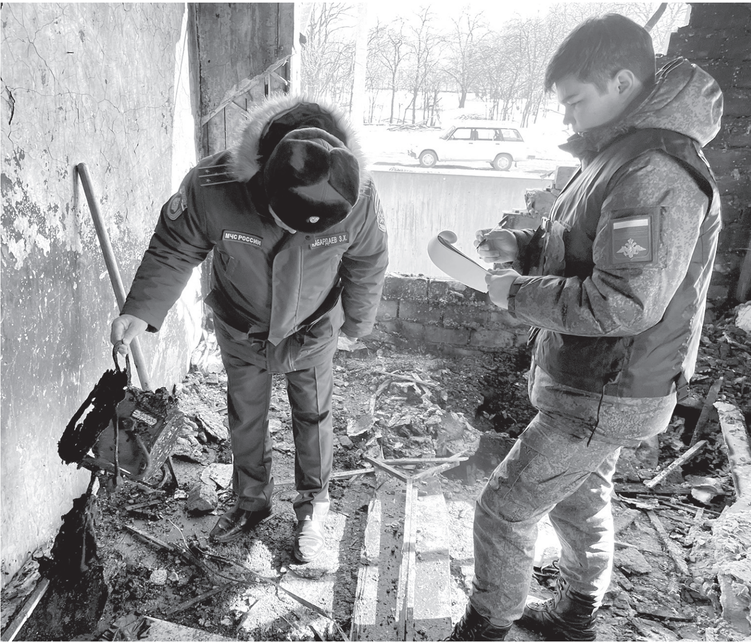
Осмотр места происшествия — пожара в домовладении с пострадавшими