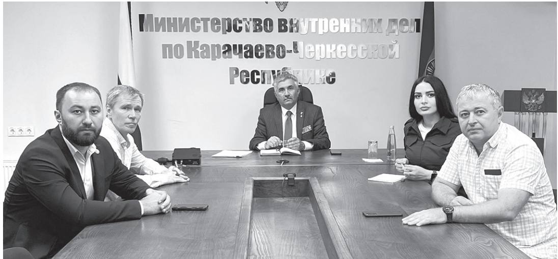
Члены общественного совета МВД по КЧР приняли участие в конференции