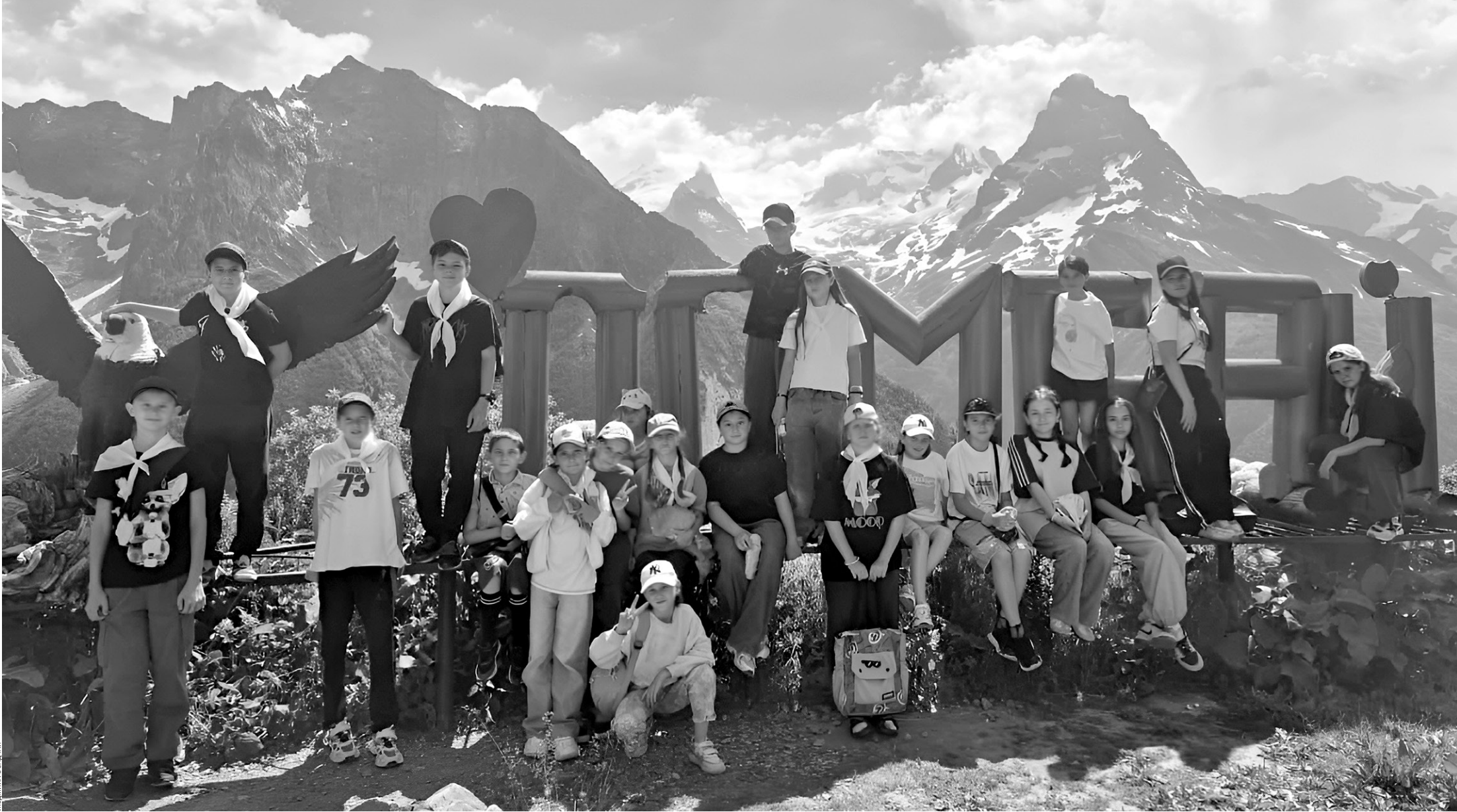
Без экскурсии на Домбай не обойтись!